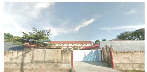
C2 UBEC English Academy 外観