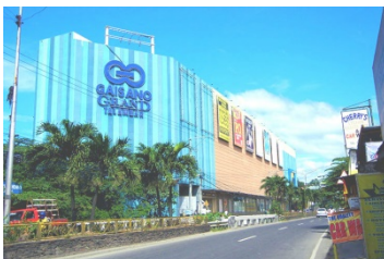
GAISANO Grand Mall